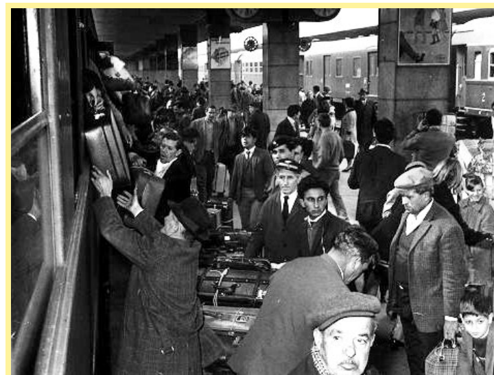
Migranti in partenza dalla stazione di Napoli, negli anni Cinquanta