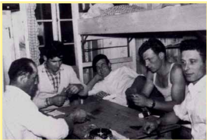
Stanza di emigrati bergamaschi in Svizzera nel 1955